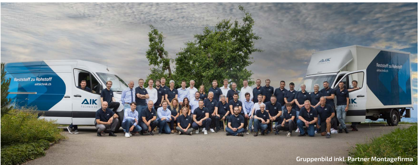
Gruppenbild inkl. Partner Montagefirma